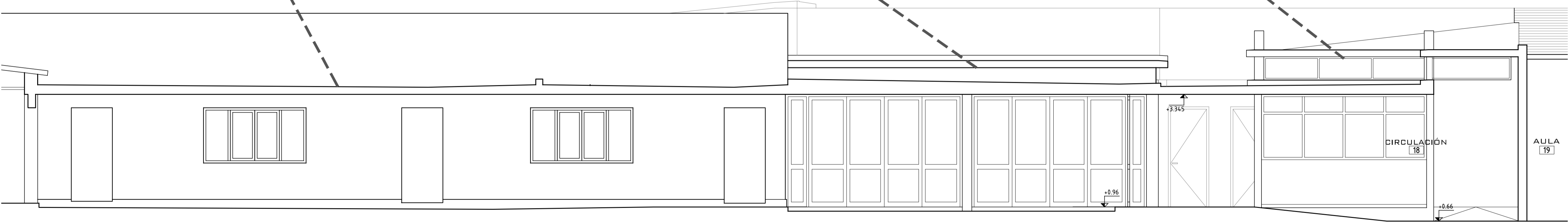
CORTE E-E ESCALA 1/50